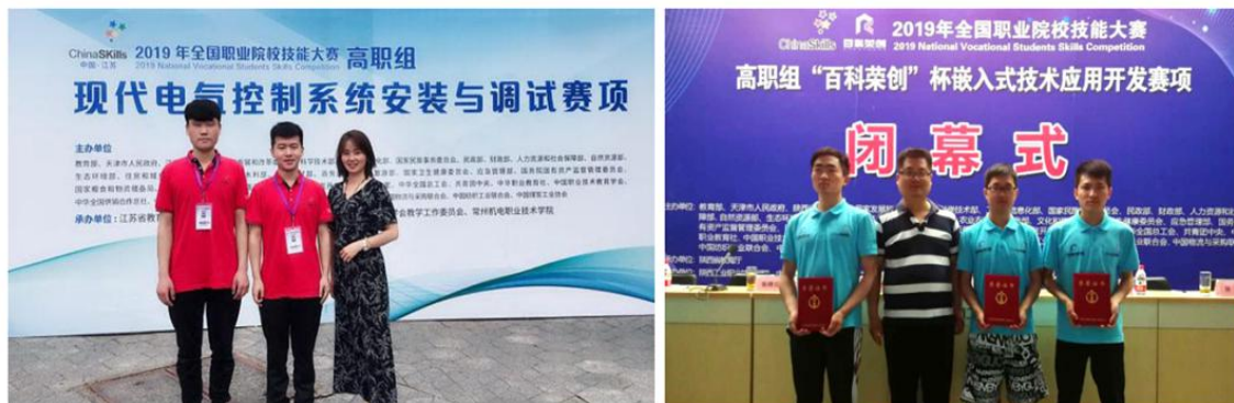
图9 全国职业院校技能大赛团体三等奖