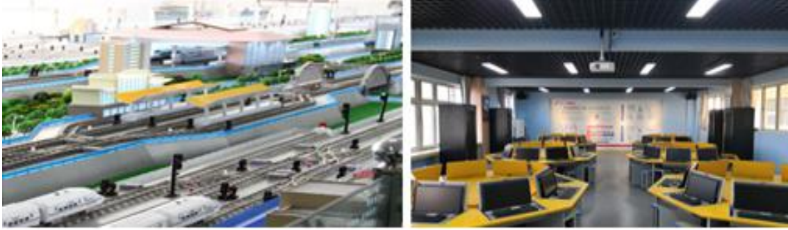
图 20 2019 年学校校内新建部分实训基地