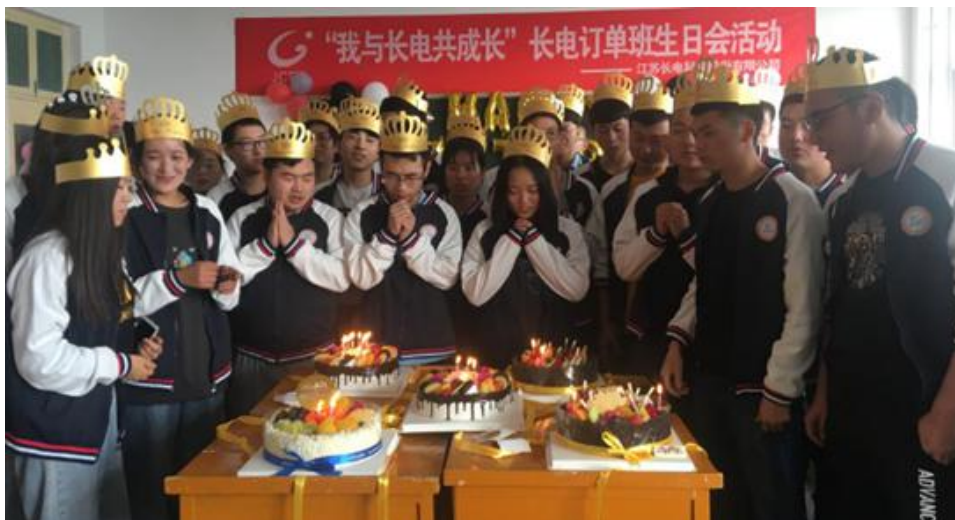
图 14 长电订单班生日会活动

学校积极与省内外知名企业开展校企合作，现开设有“长电班”、“中德 SGAVE 班”、“吉利博越班”等校企合作订单班。其中“长电班”自组建以来，开展了丰富的活动，中秋节、生日会等集体活动，丰富了学生校园生活，加强了学生、学校和企业的情感联系；企业来人进行岗前授课、技能培训，将企业文化、岗位技能培训、企业管理等融入教学中，实现了学校与企业育人的无缝对接。现 2020 届“长电班”学员均已经赴企业报到，学生踏实、勤奋，努力、进取，得到了企业的高度认可。