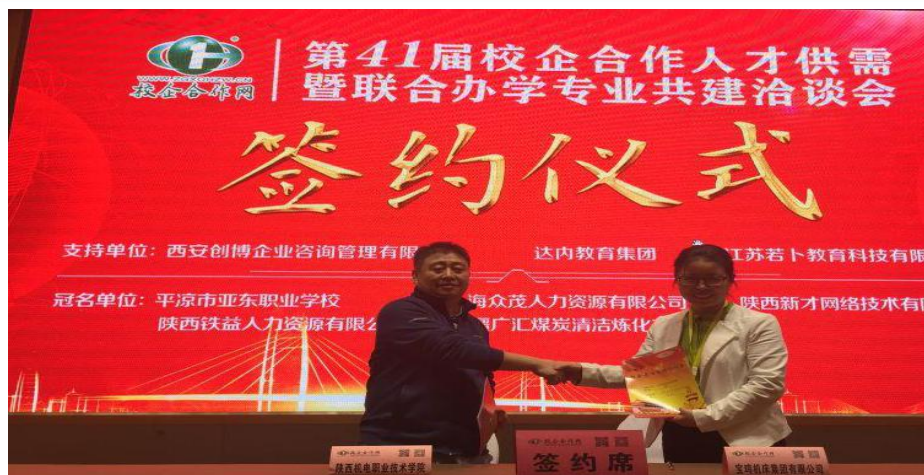
图 21 校企合作洽谈签约现场