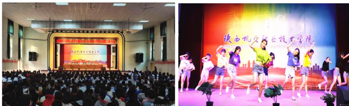
图6 2018-2019 学年学生社团表彰大会和社团风采展示活动

学校现有学生社团 37 个，指导教师 38 人，加入社团的学生 1526 人。为了保障学生社团开展活动的规范性和持续性，我校制定了《陕西机电职业技术学院学生社团管理暂行办法》、《陕西机电职业技术学院学生社团指导教师管理办法（试行）》、《陕西机电职业技术学院学生社团评优表彰办法（试行）》等一系列规章制度。2019 年举办了社团风采展示月活动、庆新中国成立 70 周年书画摄影比赛、第二届校园青年歌手大赛、迎新杯校园球类活动、博弈杯棋类比赛等一系列文化活动，这些活动都有学生社团的积极参与，通过这些内容丰富、生动活泼、形式多样的社团活动，对学生进行道德品质、身体心理、文化专业和综合能力等方面的培养和训练。