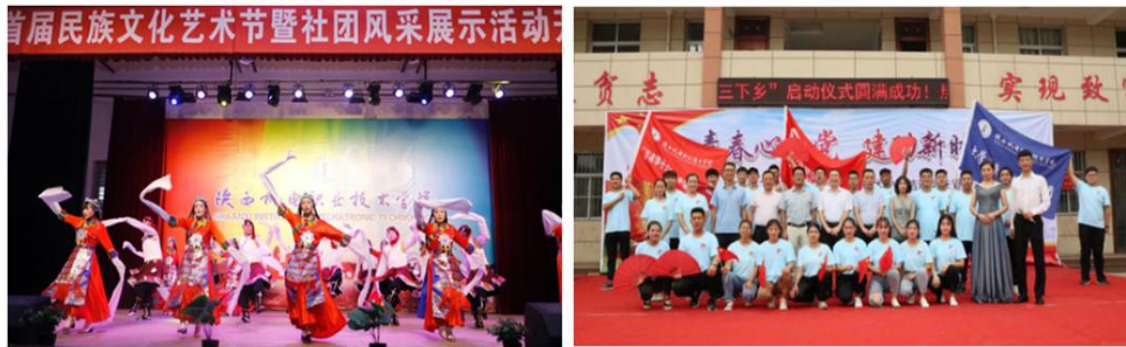
图2 民族文化艺术节暨社团风采展示和大学生暑期“三下乡”社会实践服务