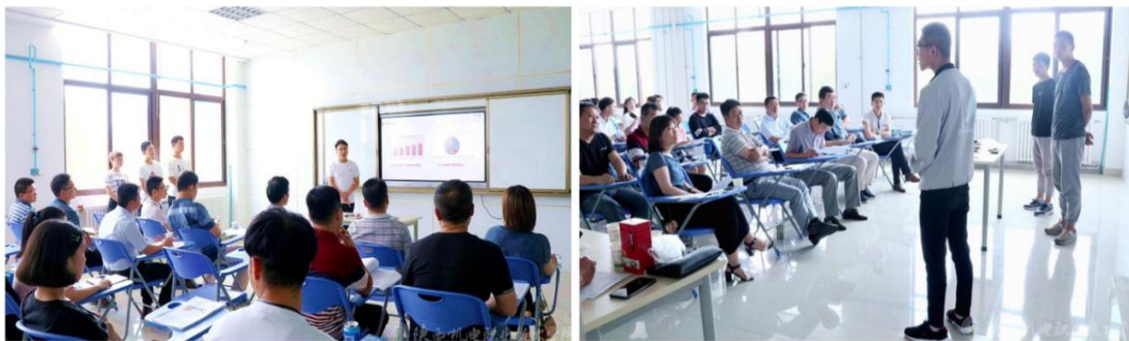
图 13 “互联网+”大学生创新创业大赛校级复赛

学校每年定期举办校内大学生互联网+创新创业大赛”以赛促练、以赛促学，打造锻炼平台，锻炼学生创新创业能力；积极推荐优秀项目参加省级比赛，展示大学生创新创业工作成果。2019年推荐项目分别获得第五届“互联网+”大学生创新创业大赛陕西赛区职教赛道铜奖和青年红色筑梦之旅赛道铜奖。