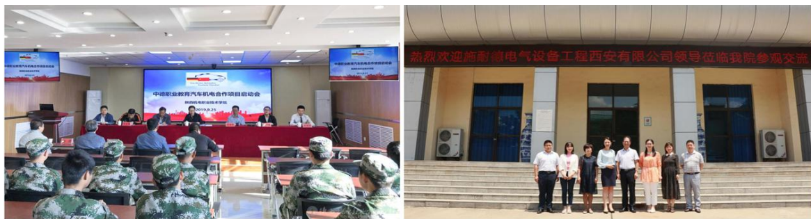
图 24 探索产教融合、校企合作的国际化人才培养模式

7月学校与施耐德电气设备工程西安有限公司洽谈校企合作事宜，推动学校与施耐德电气的校企合作发展，校企双方在师资培训、学生就业等方面达成共识。9月，中德职业教育汽车机电合作项目（SGAVE）正式启动，学校借助项目合作平台优势，推动数字化教学资源的共享共建，为项目实施提供必要的条件和保障，积极探索产教融合、校企合作的汽车机电技术国际化人才培养模式。