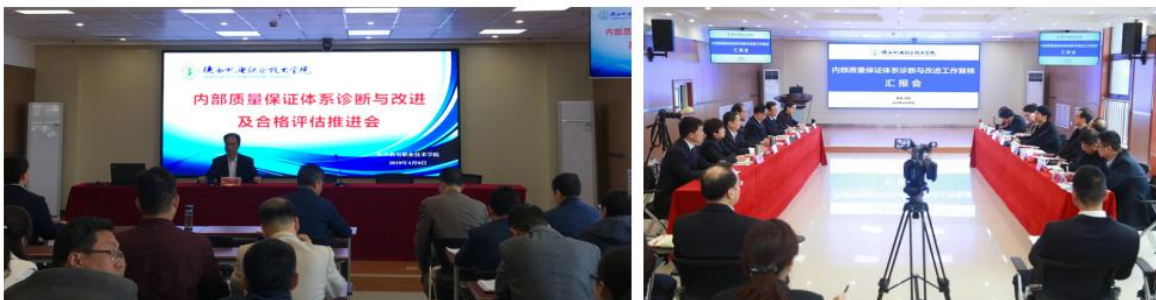
图 29 学校内部质量保证体系诊断与改进相关工作