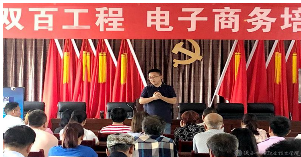
图 36 学校助力“双百工程”眉县猕猴桃电商培训再升级