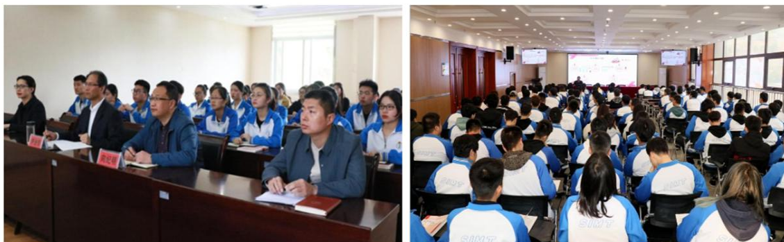
图5 思想政治理论课师生座谈会和学校领导为学生作《形势与政策》讲座