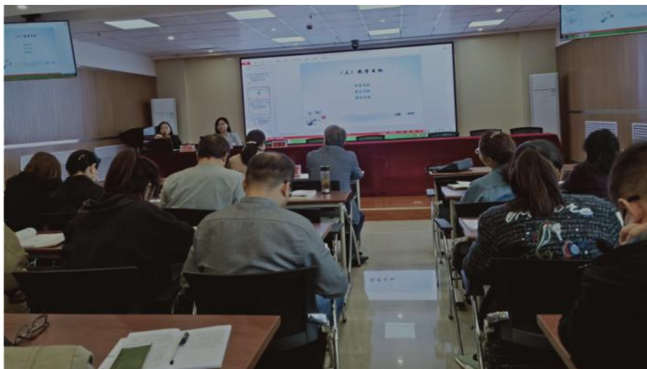
图 23 我校举办专业剖析和说课专题讲座

习、不断改进的预期效果，对促进我校人才培养方案的优化、推动人才培养质量的提高起到了积极作用。