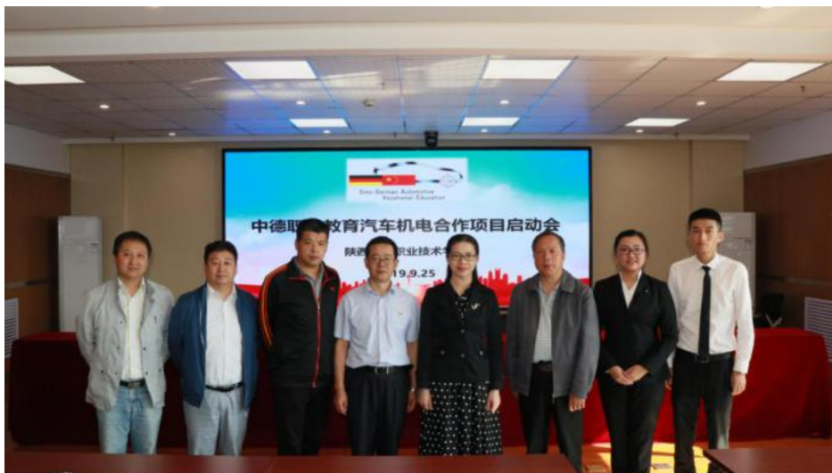
图 25 中德职业教育汽车机电合作项目启动会

9月25日, 中德职业教育汽车机电合作项目启动会在我校隆重召开。该项目旨在充分利用德国在汽车领域雄厚的技术和经验储备, 联合构建符合现代汽车维修和维护行业需求的专业人才培养体系, 共同开发适应我国国情的汽车机电技术人才培养方案。项目启动后, 汽车与交通学院派出4名教师赴无锡参加“中德汽车职业教育”(SGAVE) 项目合作院校师资认证培训。学校将以此合作项目为契机, 建设汽车机电技术中德合作基地、平台, 以汽车机电技术专业国际化为突破口, 大力提升我校汽车专业的办学水平和教育质量。