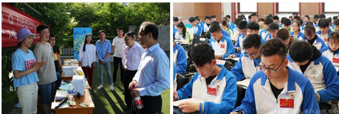
图3 5·25心理健康宣传日活动和团学代会第二次全体会议

加强学生会工作的规范化、制度化建设，充分发挥学生干部“自我教育、自我管理、自我服务”的作用，进一步完善学生干部队伍建设。坚持实行辅导员、值周干部入住公寓制度等，把学校的“九维育人”思想全面落实到学生管理工作全过程。学生心理健康工作中通过互联网、广播站、专题讲座，培训等形式传播心理健康知识，解决学生在环境适应、学习问题、人际交往、交友恋爱、人格发展、情绪调节和求职择业等方面遇到的困惑和疑虑，并对存在心理隐患的学生进行积极引导，收到了良好的教育效果。少数民族学生管理中学校把加强民族团结和爱国主义教育不断地渗透在学校工作各方面，贯穿于人才培养全过程，通过开展向民族学生献爱心、民族学生展才艺等活动，从政治上、思想上、感情上促进各族学生健康成长。