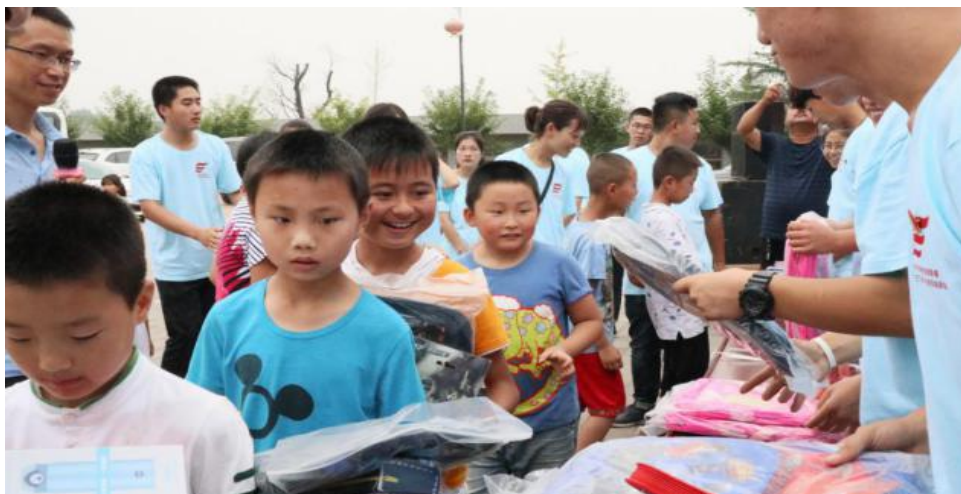
图 37 大学生暑期“三下乡”系列活动

学校将大学生暑期“三下乡”系列活动与学院“双百工程”扶贫工作相结合、与“万名学子扶千村”工作相呼应，组建电商创业服务团、情暖童心实践团、理论普及宣讲团、文化艺术服务团、科普宣传服务团等志愿服务团队，围绕科教兴国、关注三农、振兴乡村战略和新农村建设、关注留守儿童等方面开展习近平新时代中国特色社会主义思想宣讲、电商培训讲座、文艺节目演出、“情暖童心”关爱农村留守儿童等活动。促进了我校大学生和基层生活的农民朋友亲切接触，真正做到贴近农民生活，促进城乡互动。将师生积极向上的精神面貌向全社会展现出来，活动真正实现深入基层、调研基层、服务基层，服务当地乡村振兴战略。