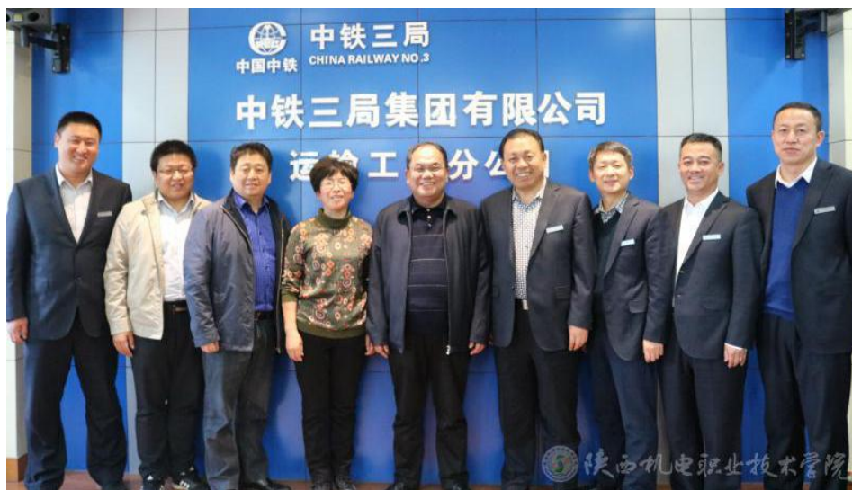
图 12 校领导带队赴中铁三局考察拓展就业渠道

流考察活动，开拓了学校校企合作与就业市场，确保了学校 2020 届铁道信号、铁道工程、高铁乘务等相关专业学生的顺利就业。