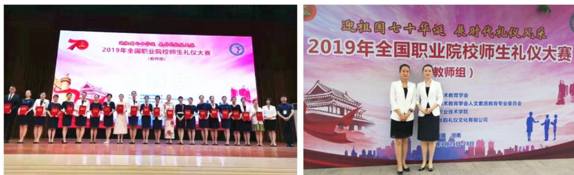
图 18 经济管理与艺术学院教师在全国职业院校师生礼仪大赛获三等奖

的职业教育课堂教学模式。引导教师从课堂教学中遇到的实际问题进行选题立项，展开教学方法方面的课题研究。组织教师认真学习教学设计的设计方法、信息技术的应用方法、教学课件特别是微课的制作方法，把项目教学法、案例教学法、情景教学法等教法进行综合应用，形成有效的混合式教学方式，坚持“学生为主体、教师为主导”的教学原则，突出教学重点，突破教学难点。鼓励教师参加教学能力比赛，以比赛促进教师教学方法、教学模式、教学评价的创新与改革，提高课堂教学质量。