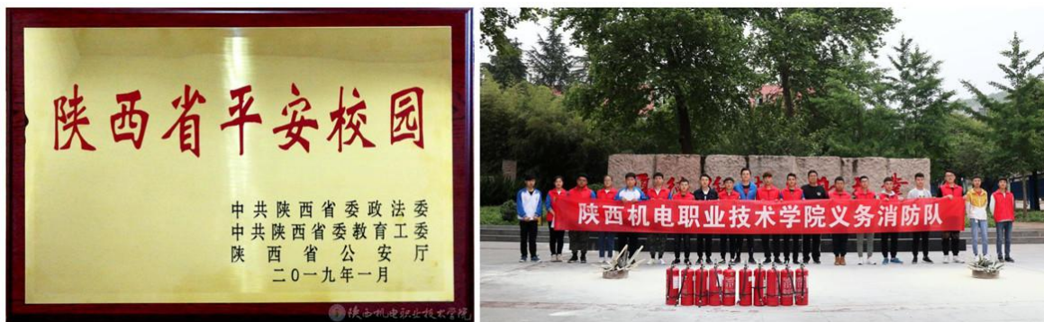
图 26 巩固和发展省级“平安校园”创建成果

持续进行基础设施建设，美化校园景观，实施校区空气热能及直饮水改造项目，对 1#和 2#教学楼、2#女生公寓楼进行升级改造，进一步改善办学条件。强化后勤保障服务，加强对食品安全、水电等重点工作的检查维护，推进后勤服务社会化管理；定期召开教师座谈会、学生座谈会，及时了解师生所思所想所愿，采取有力措施改进工作，依法保障教职工和学生合法权益；建设“陕西省平安校园”和全省高教系统“文明校园”，工作成效显著，2019年1月，学院被授予“陕西省平安校园”荣誉称号，12月，文明校园建设顺利通过评审。全校师生的获得感和幸福感进一步提升。