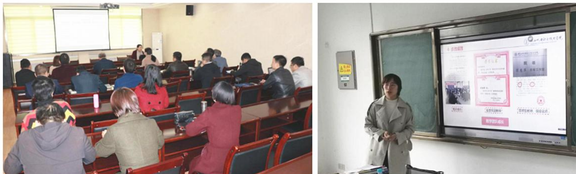
图 22 教务处组织专业剖析和说课活动

企业课堂，推进前校后厂模式，把企业搬进校园，自办陕西信创机电有限公司，在电子信息工程技术、数控技术专业进行现代学徒制试点，通过双主体育人（学校+企业）、双导师指导（教师+师傅）、双课堂教学（校内课堂+企业课堂）、双身份学习（学生+学徒）、双评价（学校评价+企业学校），构建校内课堂与企业课程交替教学模式，同时，订单班的企业员工进校授课、“工匠进校园”等丰富企业课堂开展形式。