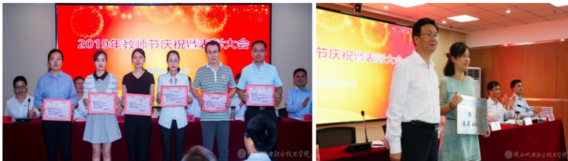
图 17 优秀教学团队和校级名师工作室授牌仪式

增强教师队伍活力，形成“能力本位”的教师使用、培养与评价机制。学校成立校级名师工作室，通过名师引领，为教师搭建实用技术的产学研实践平台，提高教师研发和实践能力，锤炼职业精神。建立政策和机制，引导教师进“行业圈子”、“职教圈子”和“学术圈子”，使教师在“三个圈子”中磨炼成长为本专业的专家型人才。打破单一专业的课程壁垒，围绕专业群建设，紧扣“平台+模块+方向”课程体系中课程模块的要求，以课程建设为核心，构建模块化课程的教学创新团队，开展模块化课程建设与实施。现已形成 11 个优秀教学团队。