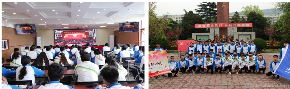
图1 师生观看纪念五四运动100周年大会和赴宝天英烈纪念馆祭奠革命烈士爱国教育活动

依托宝鸡市丰厚德文化资源，培养师生爱国之志，组织大学生代表赴宝天英烈纪念馆、宝鸡革命烈士陵园开展缅怀先烈祭扫活动；赴宝鸡青铜器博物馆参观学习，开展爱国主义主题实践教育活动。通过教育实践活动，让同学们加深了对党的认识，牢记党的初心使命和全心全意为人民服务的宗旨，使同学们心灵受到洗礼，思想上受到震撼。