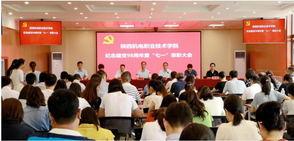
图 28 学校隆重纪念建党 98 周年暨庆“七一”表彰大会