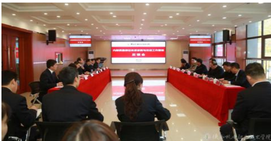
图 30 省教育厅诊改复核专家组对我校诊改工作进行复核

2017 年以来，学校通过内部质量保证体系诊断与改进工作，引导全体师生员工提升质量意识，促进全员全过程全方位育人。建立学校、专业、课程、教师、学生五层面目标链与标准链，以“8 字形质量改进螺旋”为基本运行单元，培育质量文化、形成驱动引擎，加大学校信息化建设，逐步形成全覆盖、全要素、网络化具有较强预警功能和激励作用的内部质量保证体系。2019 年，学校在完善诊改体系和常态化运行机制、加快信息平台建设、提升育人质量、推进专业课程发展、促进师资队伍优化，服务社会能力等各方面工作取得新显著成效，11 月中旬，陕西省教育厅对我校内部质量保证体系诊断与改进工作进行复核，专家组一致认为，我校诊改工作领导小组高度重视，按照陕西省高职诊改专委会审核通过的实施方案，完成了目标链、标准链打造，机构职责明确，建立了岗位工作标准，五个层面建立了“8 字形质量改进螺旋”，并开始运行，建立了考核体系与激励机制，激发了内生动力和信息化建设，完成了顶层设计并逐步推进，初步建立了内部质量保证体系，成效显现，师生员工获得感强，满意度高。