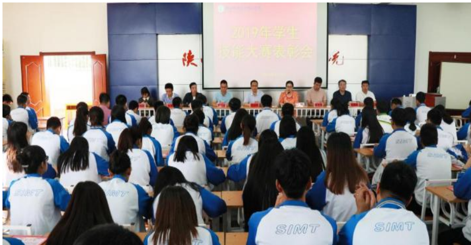
图 11 2019 年学生技能大赛表彰大会

第十三届学生技能大赛，为了让选手赛出水平，各二级院（部）在赛前结合专业特色，举行了技能项目展示活动，5月20日至28日集中进行各赛项决赛。本届大赛覆盖面广，开设有英语口语、嵌入式应用开发、动画设计与制作、PLC技术应用、汽车检测与维修、BIM、会计、舞蹈、党史国情知识竞赛等34个比赛项目，共计800余名学生参赛，营造了学生学技能、比能力的良好氛围，激发了学生专业技能学习的兴趣，提高了学生综合素质，并深入推进学校教育教学改革。