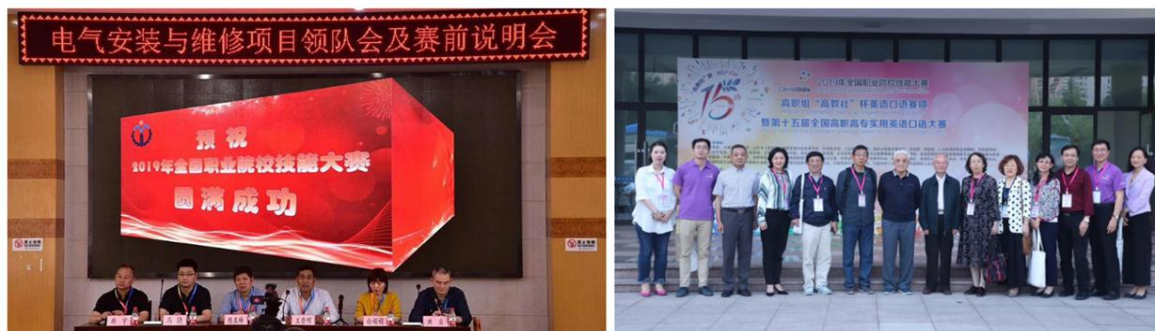
图 33 教师担任全国职业院校技能大赛评委