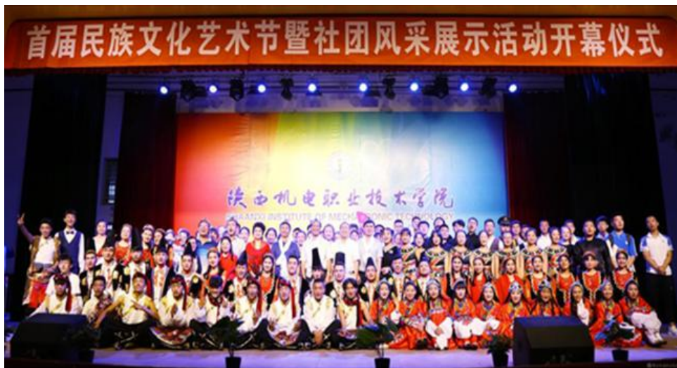
图7 社团风采展示活动开幕仪式

全校三十余个社团参加了本次活动。各学生社团通过现场实操、图文展示、趣味游戏及节目表演等多种形式展示社团风采及成果，千余名同学参与到此次风采展示中。本次民族文化艺术节暨社团风采展示活动精彩纷呈，给全校各学生社团提供了一个展示社团风采、放飞青春的舞台，突出了学校“九维育人”中社团育人这重要一环。