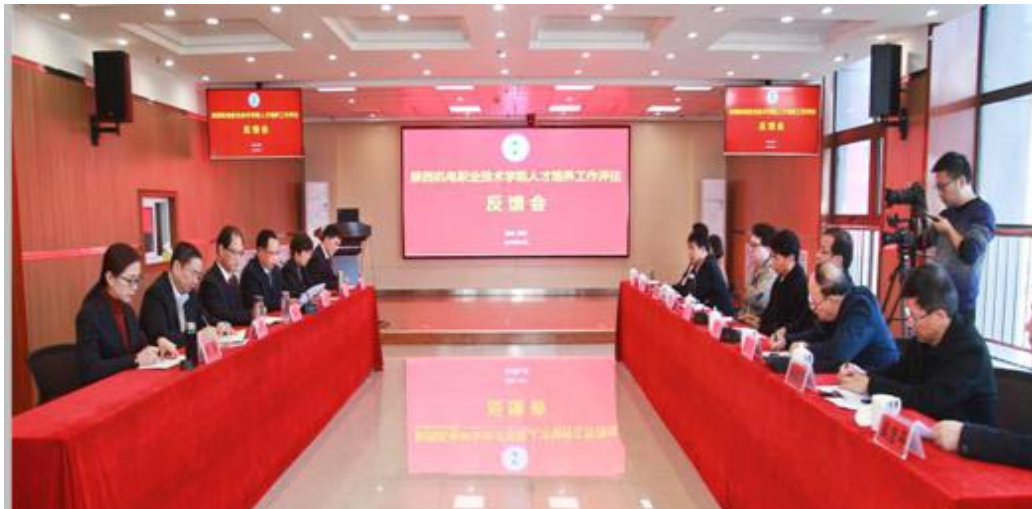
图 19 人才培养工作评估反馈会