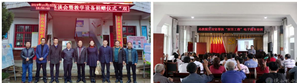
图 34 “双百工程”、“两联一包” 精准扶贫

学校继续深入贯彻落实结对帮扶眉县“双百工程”、对麟游县澄铭窑村贫困户“两联一包”精准扶贫工作的各项帮扶措施，认真履行帮扶责任。一年来通过开展“一进二访”扶贫帮困送温暖活动；对帮扶县区进行电商培训、礼仪培训、服务质量提升培训；参与文化、科技进校园活动；定向采购帮扶县特色农副产品进校园活动；为帮扶县区学校捐赠教学设备；帮助群众解决基础设施工程资金缺口等一系列举措，不断深化结对帮扶力度，拓宽帮扶途径，增强帮扶实效，促进人民群众实现持续稳定增收，确保完成“双百工程”及“两联一包”工作任务。