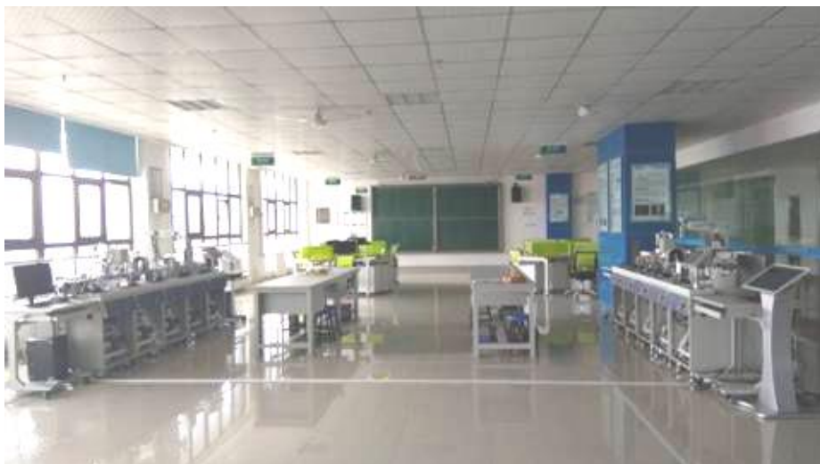
图16 校企共建智能控制技术应用中心实训室

校企共建专业实训基地、实训室16个。创新产教融合人才培养模式，在与施耐德、吉利等国内外知名企业“产教融合、校企合作”育人机制的基础上，全面实施以产业为导向、专业教学为核心，技能、创新大赛为牵引，应用技术研发项目为支撑的“产、学、研、赛”四位一体的创新人才培养模式。培养学生解决实际问题、技术研发及团队协作的能力，通过参与各类技能交流和竞赛，培养质量显著提升。近三年，该专业学生荣获国家级二等奖1项，三等奖4项，省级一等奖4项，二等奖18项，三等奖27项。