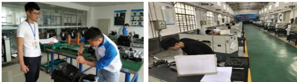
图 32 学校开展职业技能鉴定培训工作

学校重视发挥职业教育的社会服务功能，服务地方经济发展，在职业技术培训、人力资源培训等方面取得积极成效。先后为宝鸡市电子行业职工进行了电子专业技能培训，为宝鸡市凤翔职教中心、眉县职教中心等中等职业学校开展了《电子产品装配与调试》赛项的职业技能大赛集训工作，为宝鸡文理学院学生开展了《电子工艺与技能训练》课程的实训教学工作，为眉县果农开展电子商务培训等。学校职业技能培训鉴定站 2019 年开展职业技能鉴定的本校生共计 513 人，其中高级工 28 人，中级工 485 人。学校为社会技能培训方面做出了重大贡献，受到了社会各界一致好评。